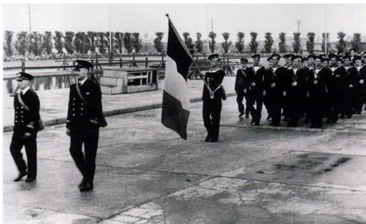
Een detachement van de RNSB—Un détachement de la RNSB

Een week later zou er geen RNSB zijn geweest, en waarschijnlijk ook geen Zeemacht die e r v a n z o u voortkomen. Premier Pierlot en minister van Buitenlandse Zaken Spaak kwamen op dat moment in Londen aan. Een Belgische regering in ballingschap wordt in Londen opnieuw samengesteld. Met h e t mobilisatiebesluit van 31 oktober 1940, dat op 22 november 1940 in de Londense