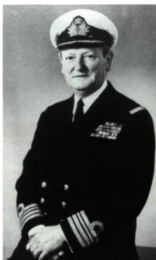
CPF Charly Van Avermaet

Er worden pools liaison officieren opgezet binnen de regionale secties en ontsnappings- en overlevingsoefeningen worden georganiseerd. Het is ook in deze periode en nog altijd binnen de vereniging, dat het idee ontstaat om een MSC ter beschikking te stellen van de reserve voor trainingsdoeleinden. Deze MSC trainingen worden in het weekend georganiseerd. Deze zullen uiteindelijk leiden tot de oprichting van Squad 218.2 in 1970.