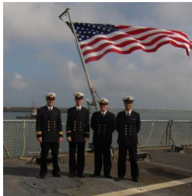
LO sur la plage arrière du USS Mount Whitney LO op het achdeck van de USS Mount Whitney

Military and Maritime Trade Interaction Cooperation (M2TIC) est une division qui se charge de l'interaction entre marines militaires et marchandes, et de la protection des navires marchands, dans le monde entier. Elle est composée exclusivement de réservistes et contribue à diverses opérations de protection de la navigation commerciale dans le monde, tant sur le plan national qu'international (OTAN et EU) comme l'opération anti-piraterie ATALANTA de l'UE dans le Golfe d'Aden. M2TIC contribue toutefois également à la sécurité des routes marchandes maritimes à partir du territoire belge. Dans le cadre d'un accord de coopération entre le SPF Mobilité et Transport, les armateurs belges et la Marine - connu sous le nom BEMTAR (Belgian Maritime Threat Awareness & Reporting) - M2TIC conseille les navires marchands belges dans des