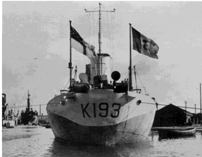
De korvet HMS Buttercup (K193) bewapend door de Belgen La corvette HMS Buttercup (K193) armée par les belges