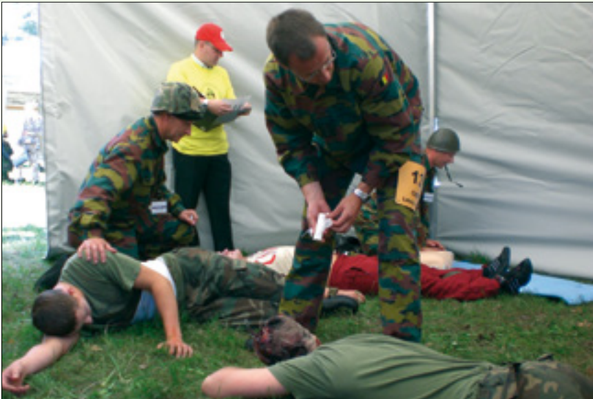
First Aid Competition on the field